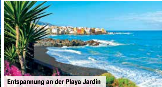
Entspannung an der Playa Jardín