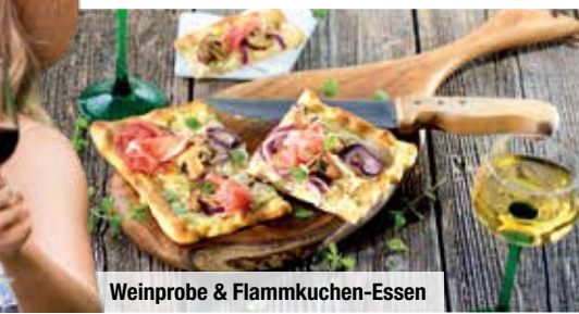
Weinprobe & Flammkuchen-Essen