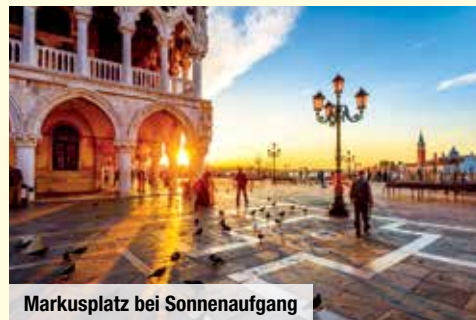
Markusplatz bei Sonnenaufgang