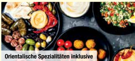
Orientalische Spezialitäten inklusive