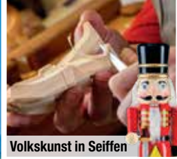
Volkskunst in Seiffen