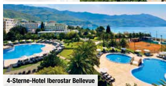
4-Sterne-Hotel Iberostar Bellevue