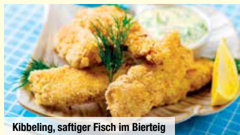
Kibbeling, saftiger Fisch im Bierteig