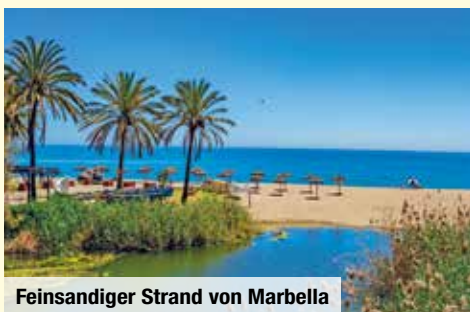
Feinsandiger Strand von Marbella

Zug zum Flug: Bequem mit der Deutschen Bahn zum Flughafen, Hin- und Rückfahrt ab allen deutschen Bahnhöfen, 2. Klasse € 69 p. P.