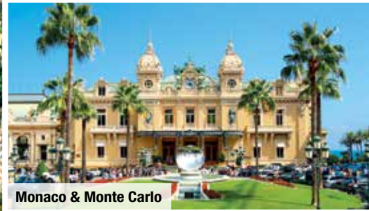
Monaco & Monte Carlo