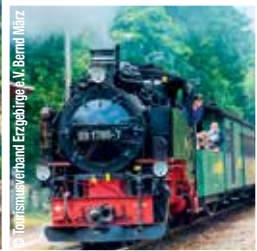
Fahrt mit der Fichtelbergbahn