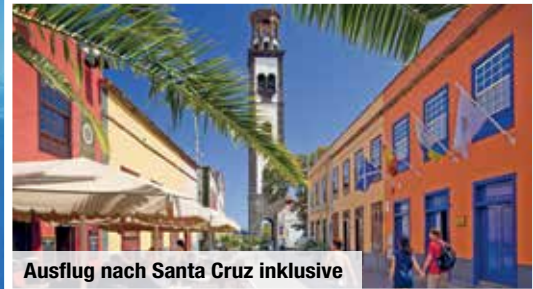
Ausflug nach Santa Cruz inklusive