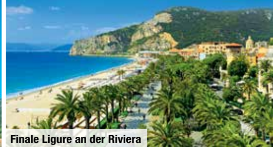
Finale Ligure an der Riviera

Gönnen Sie sich besonderen Komfort: Auf Wunsch 4-Sterne-Hotel zubuchbar!