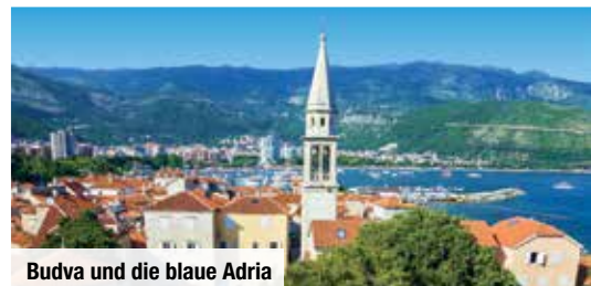
Budva und die blaue Adria