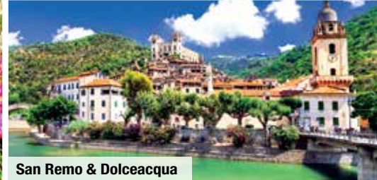
San Remo & Dolceacqua

Ein Urlaubsparadies – diese 7-tägige Erlebnisreise führt Sie an die Traumküsten Riviera und Côte d'Azur. Im Dreiländereck von Italien, Frankreich und Monaco erleben Sie Küstenidylle, sonnenverwöhnte Strände und die Städteperlen des Jetsets: Abwechslungsreiche Inklusiv-Ausflüge führen Sie nach Cannes, Nizza, Monaco & Monte Carlo, San Remo & Dolceacqua – hier steht eine geschmackvolle Weinverkostung mit typisch ligurischen Spezialitäten auf dem Programm! Dazu genießen Sie Ihre Halbpension im strandnahen 3-Sterne-Hotel oder wahlweise im eleganten 4-Sterne-Hotel. Auf Wunsch können Sie einen herrlichen Ausflug nach Portofino zubuchen – eine wunderbare Woche voll mediterraner Momente erwartet Sie!