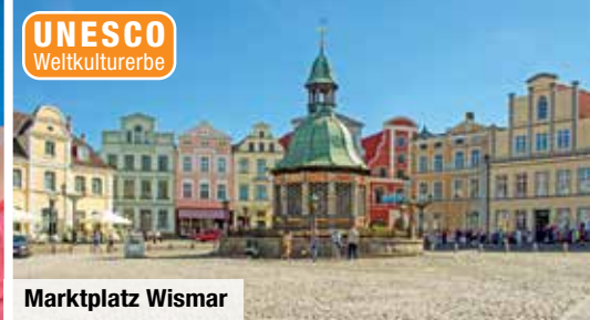
UNESCO Weltkulturerbe Marktplatz Wismar