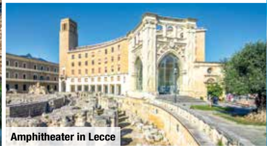
Amphitheater in Lecce