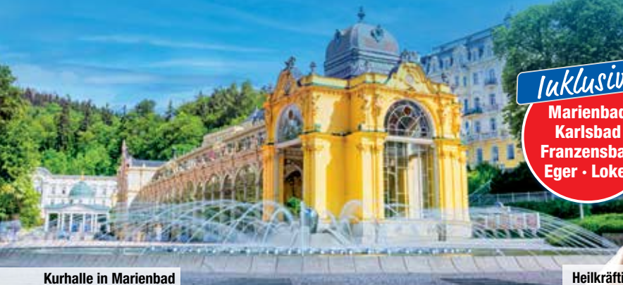
Kurhalle in Marienbad

5-tägige Busreise ins Böhmisches Bäderdreieck