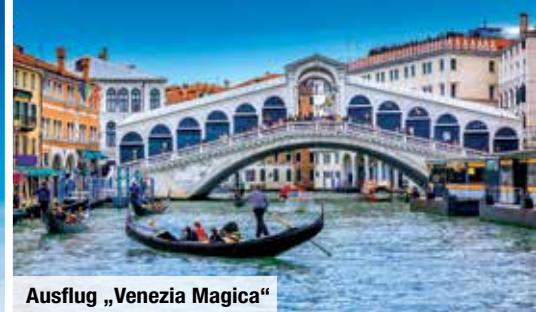
Ausflug „Venezia Magica“

Halbpension: 4 x Abendessen als 3-Gänge-Menü oder in Büfettform € 65 p. P. bei Vorabbuchung € 55 p. P.