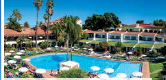
Komfortables 4-Sterne-Hotel Parque San Antonio

Wunschleistungen: Großes Getränkepaket: Täglich ein Getränk zum Abendessen (wahlweise Bier, Wein, Softdrink oder Wasser) sowie täglich zwischen 19.00 Uhr und 23.00 Uhr ein Getränk an der Hotelbar (Auswahl aus drei alkoholischen und zwei nicht-alkoholischen Cocktails, einem Bier, einem Glas Wein, einer Cola, einer Zitronen- oder Orangenlimonade oder 0,5 l Wasser), nur Vorabbuchung € 55 p. P.