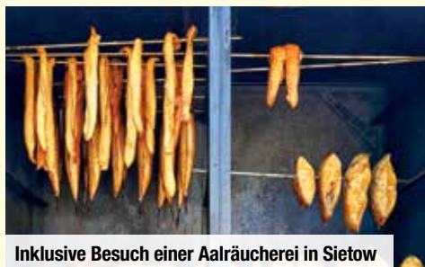
Inklusive Besuch einer Aalräucherei in Sietow

Reisetermine 2021: (Ermitteln Sie mit der 1. Stelle Ihrer Postleitzahl Ihren Reiseternin)