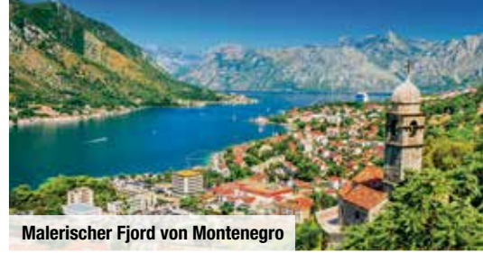
Malerischer Fjord von Montenegro