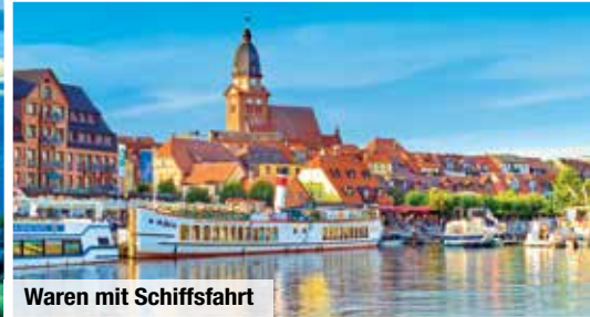
Waren mit Schiffsfahrt