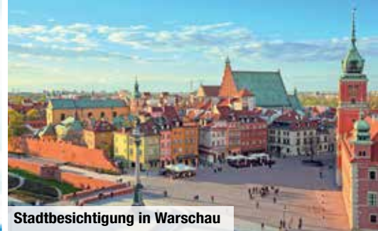
Stadtbesichtigung in Warschau