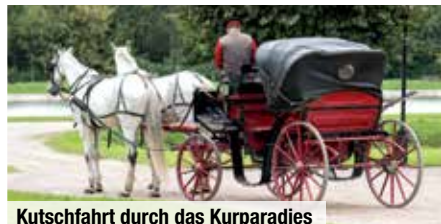
Kutschfahrt durch das Kurparadies