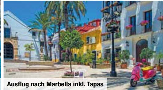
Ausflug nach Marbella inkl. Tapas

Diese 11-tägige (K)urlaubsreise führt Sie in den zauberhaften Süden Spaniens und bietet Ihnen ein umfangreiches Inklusiv-Verwöhnpaket mit 12 Kuranwendungen sowie Halbpension Plus . Freuen Sie sich u. a. auf wohltuende Massagen und Hot Stone-Behandlungen. Ihre Wohlfühl-Oase befindet sich an der sonnenverwöhnten Costa del Sol und bietet Ihnen zahlreiche Annehmlichkeiten. Auch ein Ausflug nach Marbella mit Stadtbesichtigung und Tapas-Verkostung ist bereits inklusive. Genießen Sie Urlaubsvergnügen pur an der „Küste der Sonne“!