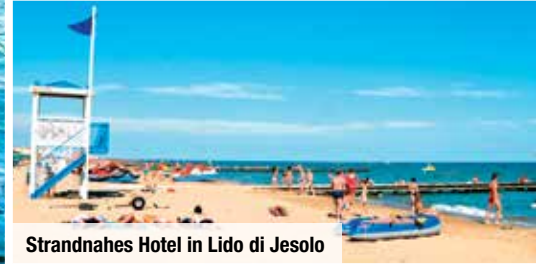
Strandnahes Hotel in Lido di Jesolo