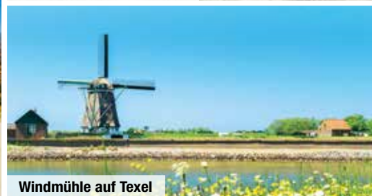
Windmühle auf Texel