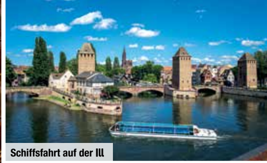
Schiffsfahrt auf der Ill