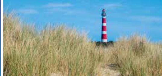
Leuchtturm auf Ameland

* Abreisetermin gilt nicht für gesamten PLZ-Bereich. Vollständige Abreisetermine und Abfahrtsstellen finden Sie unter www.trendtours.de