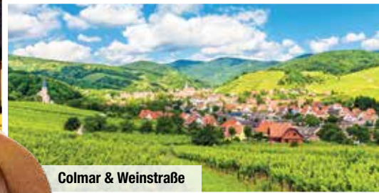
Colmar & Weinstraße