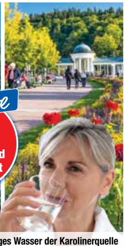
Heilkräftiges Wasser der Karolinerquelle

Marienbad Karlsbad Franzensbad Eger · Loket