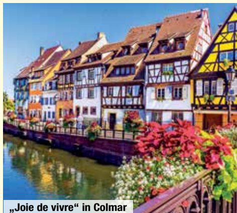
„Joie de vivre“ in Colmar

* Abreisetermin gilt nicht für gesamten PLZ-Bereich. Vollständige Abreisetermine und Abfahrtsstellen finden Sie unter www.trendtours.de