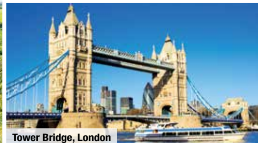
Tower Bridge, London