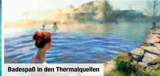
Badespaß in den Thermalquellen