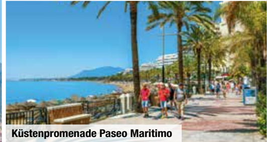
Küstenpromenade Paseo Marítimo

12 Premium-Kuranwendungen mit entspannender Wellness Massage